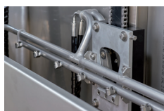
Chariot de pulvérisation