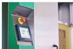
Terminal avec écran tactile