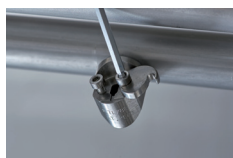
Buse spéciale Grünig