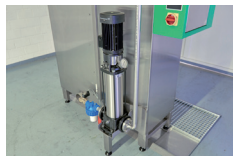
Pompe avec pression réglable