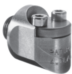
Tobera especial Grünig