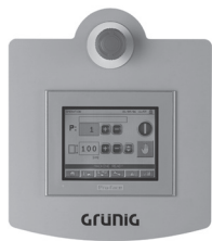
Terminal con pantalla interactiva