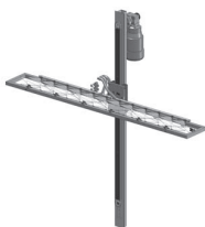
Mecanismo de accionamiento y carro de pulverización